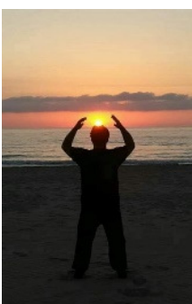
Mosaico rápido (52 sec.)